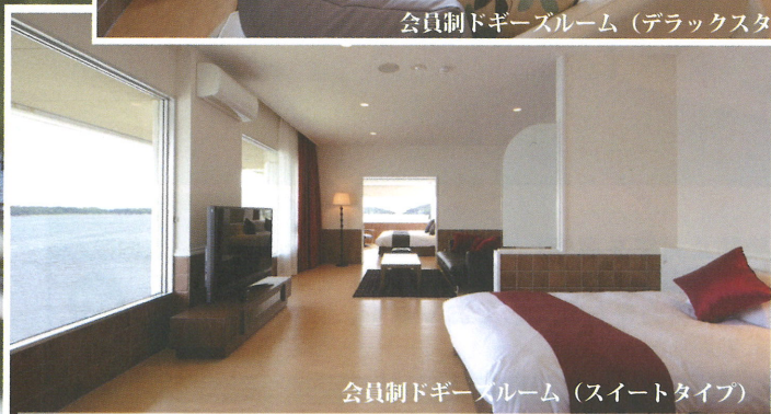
会員制ドギーズルーム (スイートタイプ)