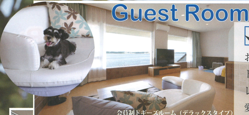
会員制ドギーズルーム (デラックスタイプ)