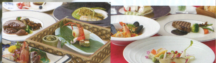
ご夕食は和食・和洋折衷・洋食からご選択できます。