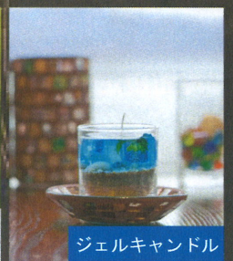
ジェルキャンドル