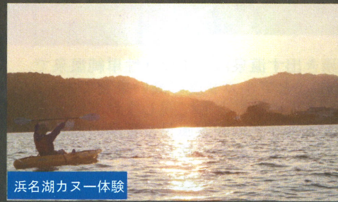
浜名湖カヌー体験