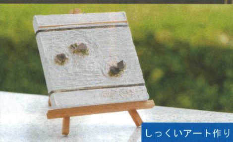
しゅくいアート作り